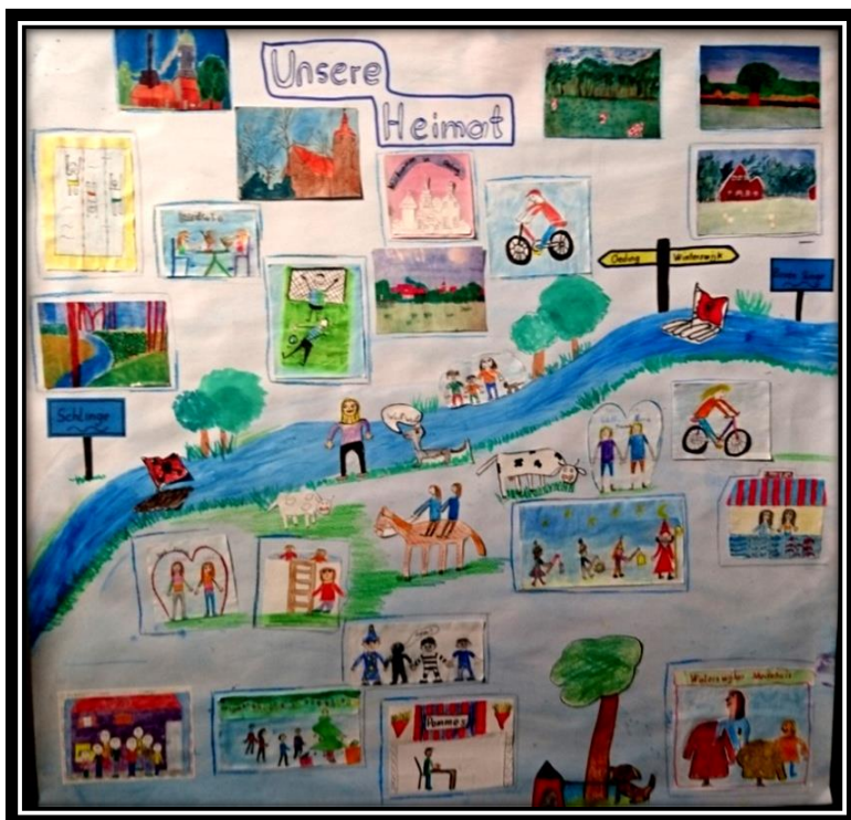
Collage der Klasse 3b

Diese Collagen wurden im Sonderausstellungsraum vom Museum „kult“ in Vreden ausgestellt.