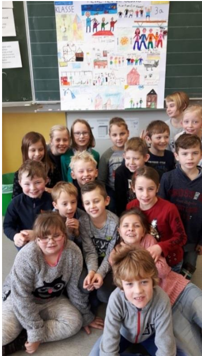
Collage der Klasse 3a

„Was ist Heimat für mich?“ Mit dieser Frage tauschten die Kinder sich in einer Gesprächsrunde aus und sammelten dazu eigene Vorstellungen.